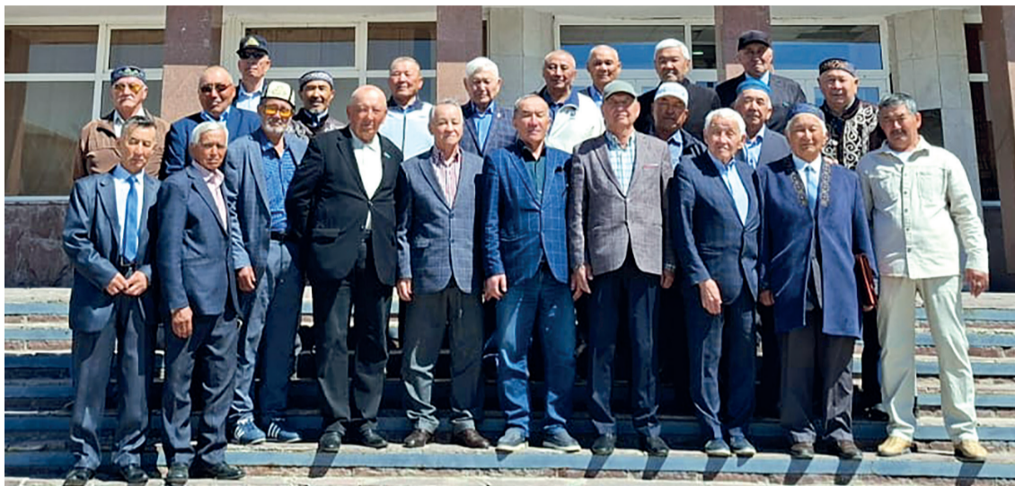
Жақында Ұлытау ауданының ардагерлері Сәтбаев қаласына арнайы сапармен барып, тағылымды саяхат жасап қайтты.